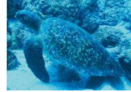
ITINERARIO EN CORTO

Día 1 Llegada a Baltra / Traslado a Santa Cruz / Parte Alta (Tortugas Gigantes)